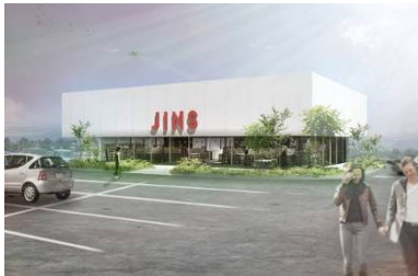
白とガラスを基調とした シンプルな外観