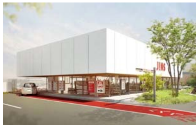
日本で初めてドライブスルー 形式のメガネ販売窓口を設置