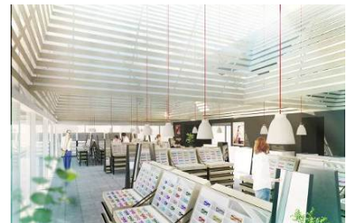
回遊性を高めた店舗設計 と豊富な商品展開数