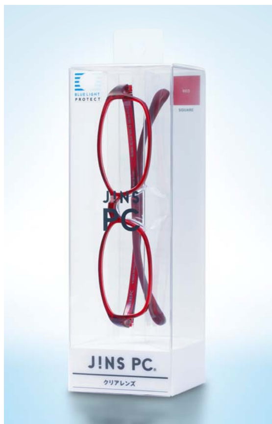
JINS PC ® パッケージタイプ クリアレンズ(度なし)

これまでの JINS PC パッケージタイプ(ハイコントラストレンズ・度なし)は、2011 年 9 月の発売以来、普段メガネを必要としない非視力矯正ユーザーを中心に高い人気を集め、JINS PC ヒットの道筋を切り開きました。以降、JINS PC は 2012 年 5 月に、お好みのフレームにブルーライトカット機能を備えた度付レンズを装着できる「カスタマイズタイプ」のサービスを開始。さらに続く 6 月には、見た目の自然さからオフィスワーカーからの要望が強かったクリアレンズ(度付対応可)を「カスタマイズタイプ」のラインアップに追加しました。さまざまなアイウェアニーズに幅広く対応できる充実のラインアップにより、発売からわずか 1 年で、PC 用アイウェアとしては No.1 の累計販売本数 75 万本突破(2012 年 9 月末時点、度付含む)を記録いたしました。