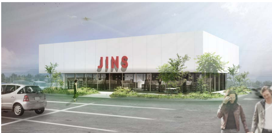
「JINS パワーモール前橋みなみ店」完成イメージ

株式会社ジェイアイエヌ(東京本社:東京都渋谷区、代表取締役社長:田中仁)は、全国への出店拡大に伴い、2013年4月19日(金)に、群馬県前橋市新堀町のベイシア前橋みなみパワーモール敷地内に「JINS(ジンズ) パワーモール前橋みなみ店」をオープンいたします。